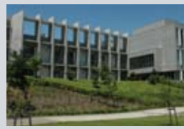
早稲田リサーチパーク 産学連携施設 100本庄早稲田